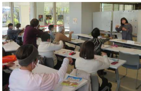
プラザ内手話講座の様子