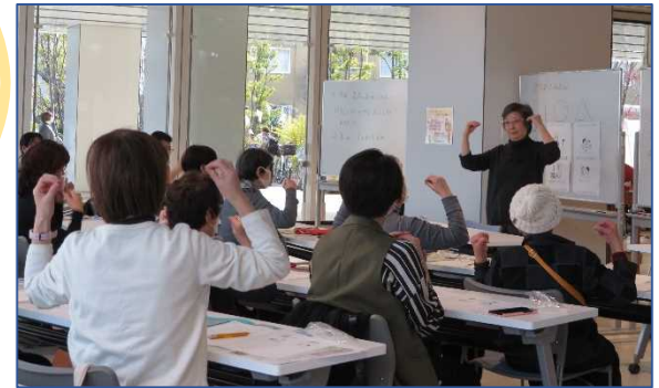
手話カフェの開催風景