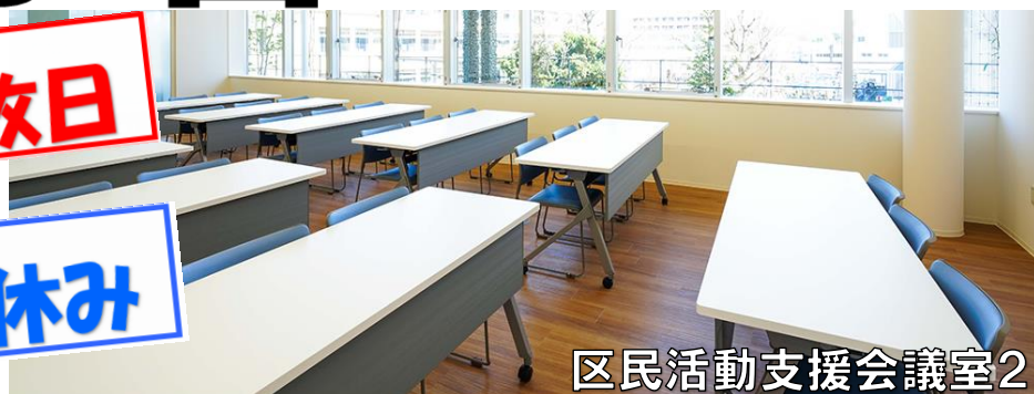
区民活動支援会議室2

この度、団体利用のない時間の有効活用として 小・中・高校生を対象とした学習ルームを開設 いたしますのでご利用ください。 ※小学生は高学年 5, 6年生が対象です