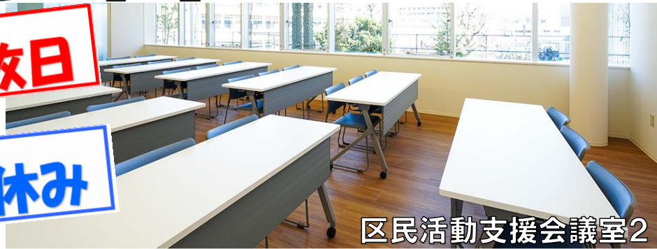
区民活動支援会議室2

この度、団体利用のない時間の有効活用として 小・中・高校生を対象とした学習ルームを開設 いたしますのでご利用ください。 ※小学生は高学年 5, 6年生が対象です