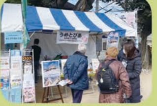
カフェイベントを紹介

令和6年2月11日・12日、「第45回せたがや梅まつり」の官公署PRブースに出展しました。好天に恵まれ、満開の梅園には多くの人出がありました。大きく「うめとぴあ」と書かれたのぼりを見て、足を止めた人に資料を渡し、簡単な施設紹介を行いました。