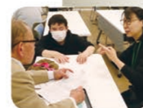
点字カフェ 点字器と点筆を使って文字や記号の打ち方を学ぶ