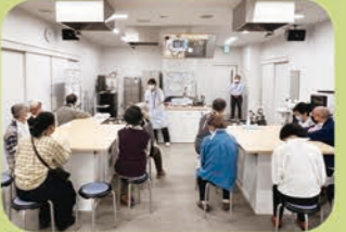
調理実習室で管理栄養士による講座も

令和6年2月19日と3月25日、「うめとぴあツアーウォーク&保健センター健康レシピ試食会」を開催しました。世田谷区保健センターの運動指導員と簡単な運動の後に保健医療福祉総合プラザを見学し、栄養指導とレシピの試食を行いました。