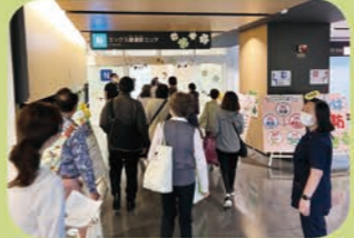
保健センター見学ツアーの様子

令和5年6月3日、来て、見て、知ってもらえるきっかけづくりとなる「うめとぴあフェスタ」を開催しました。スタンプラリーをしながら施設内事業所のイベントをめぐり、ダンスやライブ演奏、マルシェなど、多くの人々が来場しました。