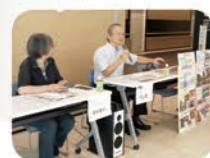
せたがや生涯現役カフェ 生涯現役ネットワークの活動団体代表によるトーク