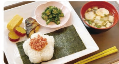
塩分を控え、彩り豊かなプレートに

「蒸し鶏の梅うどん」や「おはぎと大福アイス」などの季節メニューも人気があり、離乳食や介護食などの利用もありました。ドリンクメニューも豊富で、来館の際に、ゆっくりと過ごせる場所として活用されています。