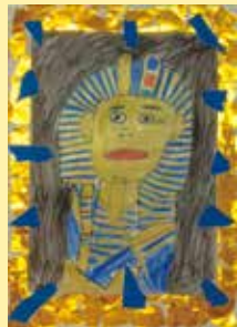
千歳台福祉園 永木 貴道