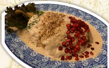
伝統料理 チレスエンノガダ

日本経済新聞の元メキシコシティ支局長。メキシコ国立自治大学 (UNAM) に留学を経験、新型コロナウイルス禍の2020年4月から21年9月に駐在した。中南米在住通算約10年。著書に「ブラジルが世界を動かす」(平凡社新書)。