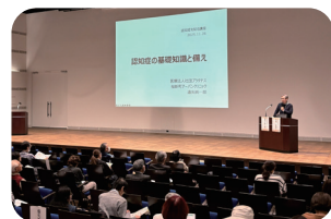
昨年度の「認知症を知る講座」の様子。多くの方が熱心に耳を傾けていました