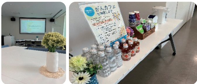
(左) 昨年度の「がんカフェ」の様子 (右) 飲み物を飲みながら語り合いました